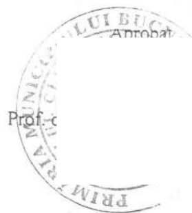
TABEL GARZI CHIRURGIE II LUNA MAI 2026